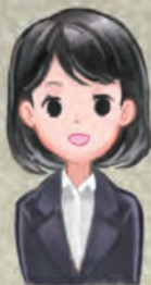
東京ジョブコーチ コーディネーター

Q6.雇用している障害のある社員のことで相談したいことがあります。対面またはリモートで相談は可能でしょうか？