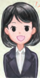
東京ジョブコーチ コーディネーター