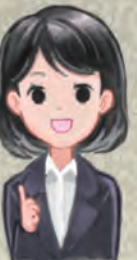
東京ジョブコーチ コーディネーター

A2.支援申し込み・問い合わせの受付・相談窓口です。コーディネーターが 支援依頼内容を確認し、支援を担当するジョブコーチのスケジュール調整 などを行います。