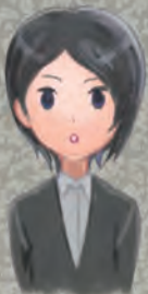
就労支援センターD