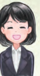
東京ジョブコーチ コーディネーター

A3.ご依頼の際には、下記3点の書類提出をお願いしています。 提出書類は東京ジョブコーチ支援センターホームページより ダウンロードできます。