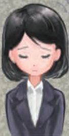
東京ジョブコーチ コーディネーター

Q5.“東京ジョブコーチ職場定着支援”とありますが、就労移行支援事業所の提供する“就労定着支援”と併用できますか？